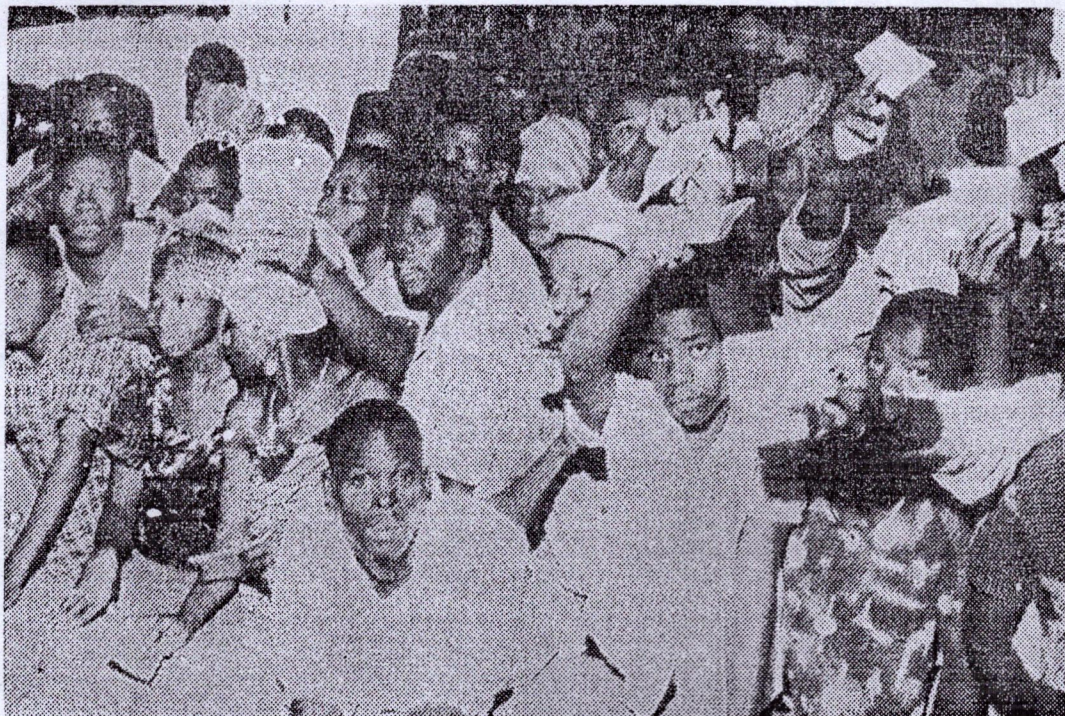
Image des élections présidentielles et législatives

Ainsi un à un, les militants s'acquittent de leur devoir dans la plus grande dignité mais aussi dans la plus grande discrétion. Chacun d'eux aurait souhaité être le premier dans son comité à s'acquitter, avec combien de plaisir de ce devoir, de son droit de voter.